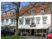
Hotel Restaurant Die Port van Cleve *** (Enkhuizen)